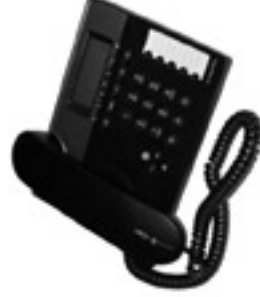
analoges Telefon Concept P412

Beim digitalen Telefonanschluss erhalten Sie zwei Rufnummern und können zwei digitale Endgeräte anschließen.