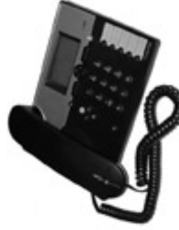
digitales Telefon Concept P622