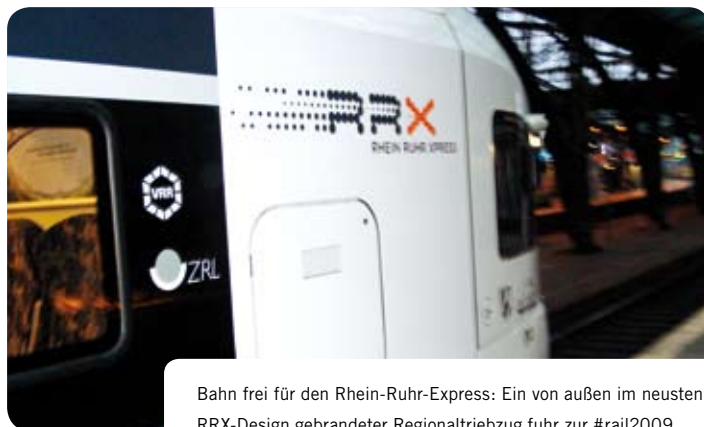
Bahn frei für den Rhein-Ruhr-Express: Ein von außen im neuesten RRX-Design gebrandeter Regionaltriebzug fuhr zur #rail2009.

Beim RRX handelt es sich in der Hauptsache um Verkehrsinfrastruktur, die vom Bund finanziert wird. Bereits Ende November 2008 hat der Haushaltsausschuss des Deutschen Bundestages die Finanzierung des RRX in den Bundeshaushalt 2009 aufgenommen. Die DB folgt dem durch die Aufnahme des Projektes in ihre Investiti-