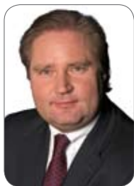
Lutz Lienenkämper, Minister für Bauen und Verkehr des Landes Nordrhein-Westfalen

Der Rhein-Ruhr-Express (RRX) ist das Medienthema der #rail2009. Sowohl der eindrucksvolle Messestand des Landes Nordrhein-Westfalen als auch die gestrige Sonderfahrt auf der künftigen RRX-Kernachse Köln–Düsseldorf–Dortmund rücken den schnellen Metropolenzug europaweit in den Blickpunkt. NRW-Verkehrsminister Lutz Lienenkämper erläutert die Ziele, die das Land mit dem RRX verbindet.