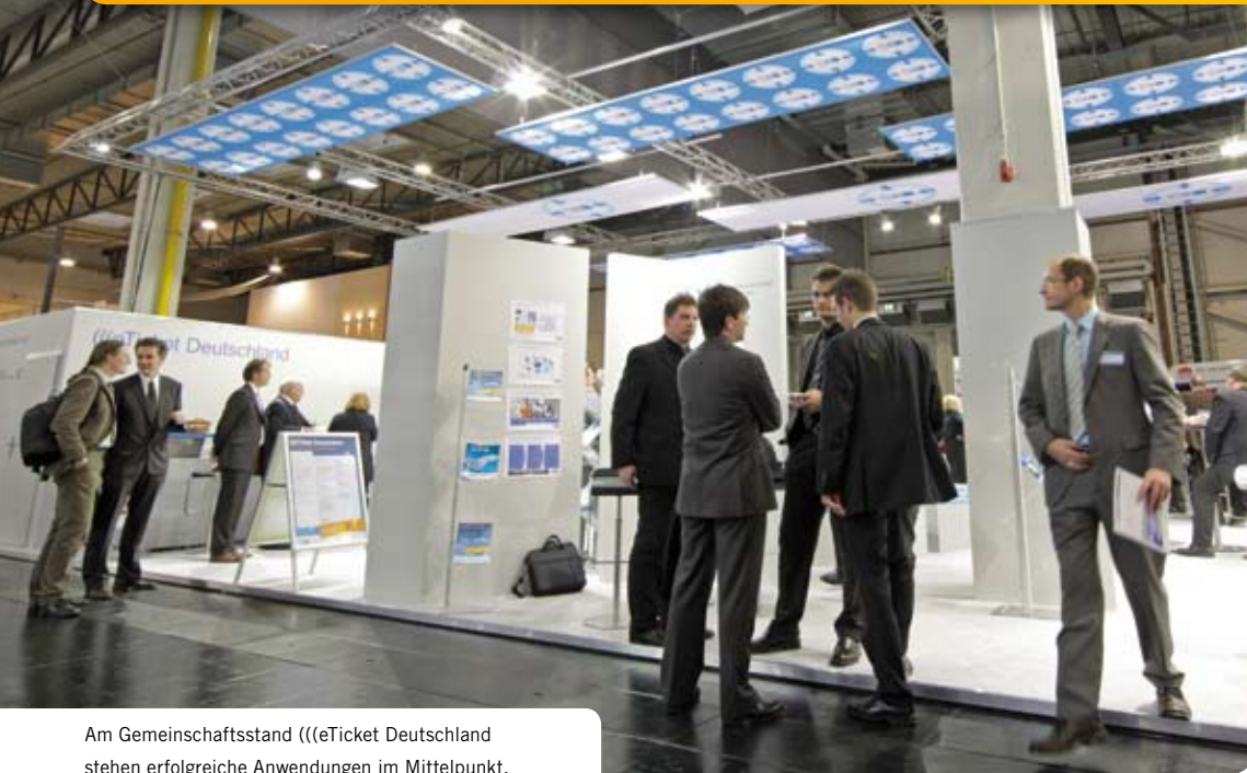
Am Gemeinschaftsstand ((eTicket Deutschland stehen erfolgreiche Anwendungen im Mittelpunkt.