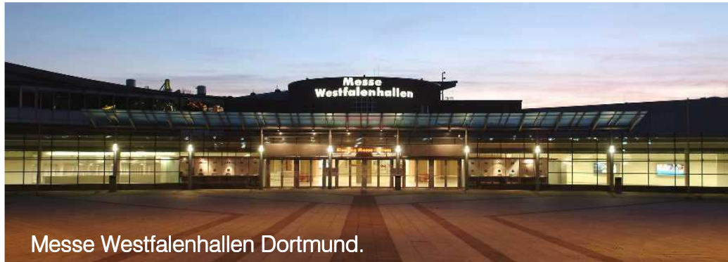
Messe Westfalenhallen Dortmund.