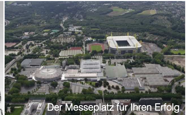
Der Messeplatz für Ihren Erfolg.