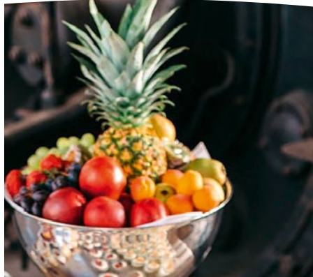
KHC Westfalahallen GmbH